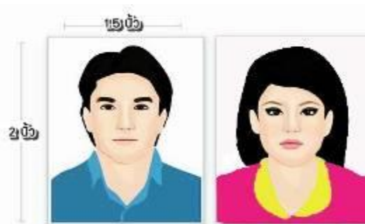
ตัวอย่างรูปถ่ายยื่นวีซ่า

7. ผู้ที่ประสงค์จะใช้หนังสือเดินทางราชการ หรือ ใช้บัตร APEC ในการเดินทางและยกเว้นการทำวีซ่าจีน ท่าน จะต้องรับผิดชอบในการอนุญาตให้เข้า-ออกประเทศด้วยตนเอง เนื่องจากบริษัทฯ ไม่ทราบกฎกติกาในรายละเอียดการยกเว้นวีซ่า / ผู้ใช้บัตร APEC กรุณาดูแลบัตรของท่านเอง หากท่านทำบัตรหายในระหว่างเดินทาง ท่านอาจต้องตกค้างอยู่ประเทศจีนอย่างน้อย 2 สัปดาห์